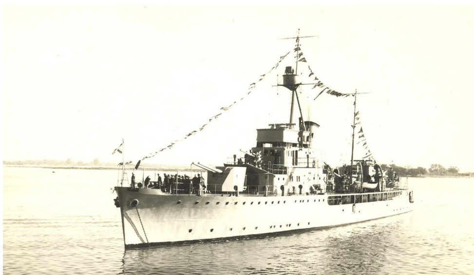
Uno de los cañoneros de Bozzano.

Los flamantes cañoneros Paraguay y Humaitá llegaron a Asunción el 5 de mayo de 1931. Ambos cañoneros cumplieron un papel fundamental en toda la guerra del Chaco (1932-1935). En varios pasajes de sus escritos Bozzano resaltó la importancia de sus actividades de dominio de la navegación del río Paraguay, traslado de tropas al frente de batalla, evacuación de personal y heridos y apoyo y sostenimiento logístico del Ejército. Sobre su poder destacó que si Bolivia hubiera tenido su “escuadrón naval de Matto Grosso, uno sólo de nuestros cañoneros lo hubiera destruido en menos de dos horas, y los dos , hubieran podido hacer frente a cualquier escuadrón naval de aquella época” 34 . Se destacaron, por ejemplo, sus numerosos viajes de transporte de tropas hasta Puerto Casado (allí eran desembarcadas y trasladadas por el ferrocarril que, partiendo desde Puerto Casado, penetraba al interior del territorio chaqueño y llegaba hasta los sitios de concentración y operaciones).