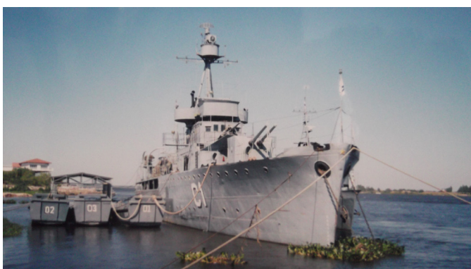
Cañonero "Paraguay" (Asunción, 2006).

Los cañoneros Paraguay y Humaitá demostraron las cualidades profesionales de José Bozzano: su formación científica y técnica, sus conocimientos en el campo naval y de la defensa y su visión y lucidez acerca de las previsiones y necesidades del Paraguay para la defensa nacional. Durante la guerra del Chaco ambas naves fueron la columna vertebral de la defensa del río Paraguay y del servicio de transporte y logístico para el Ejército. Constituyeron, además, la base del poder naval paraguayo por varias décadas, y, al momento de escribirse este trabajo (2014), todavía permanecen a flote en aguas de Asunción.