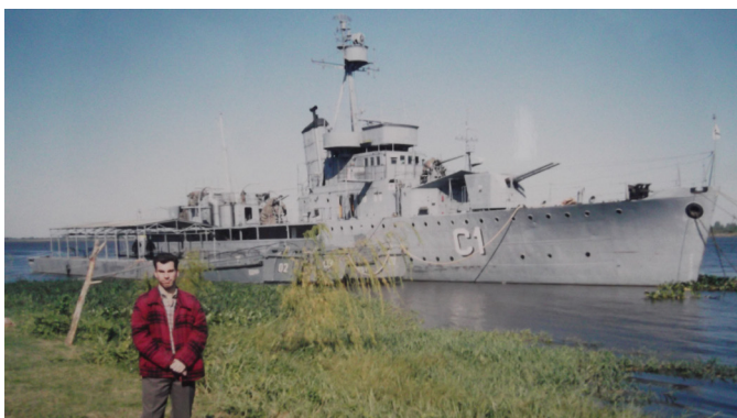
El autor junto al cañonero "Paraguay" (Asunción, 2006).